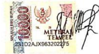
Asy Syifa Sukmawati