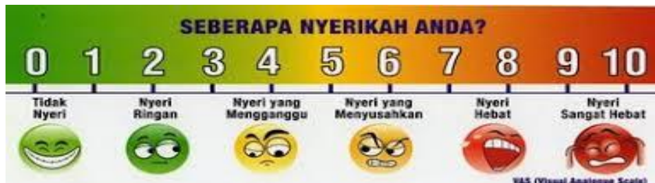
Gambar 2.1 Visual Analog Scale (VAS)

Visual Analog Scale (VAS) adalah cara menghitung skala nyeri yang paling banyak digunakan oleh praktisi medis. VAS merupakan skala linier yang akan memvisualisasikan gradasi tingkatan nyeri yang diderita oleh pasien. Pada metode VAS, visualisasinya berupa rentang garis sepanjang kurang lebih 10 cm, dimana pada ujung garis kiri tidak mengindikasikan nyeri, sementara ujung satunya lagi mengindikasikan rasa nyeri terparah yang mungkin terjadi. Selain dua indikator tersebut, VAS bisa diisi dengan indikator redanya rasa nyeri. VAS adalah prosedur penghitungan skala nyeri yang mudah untuk digunakan.