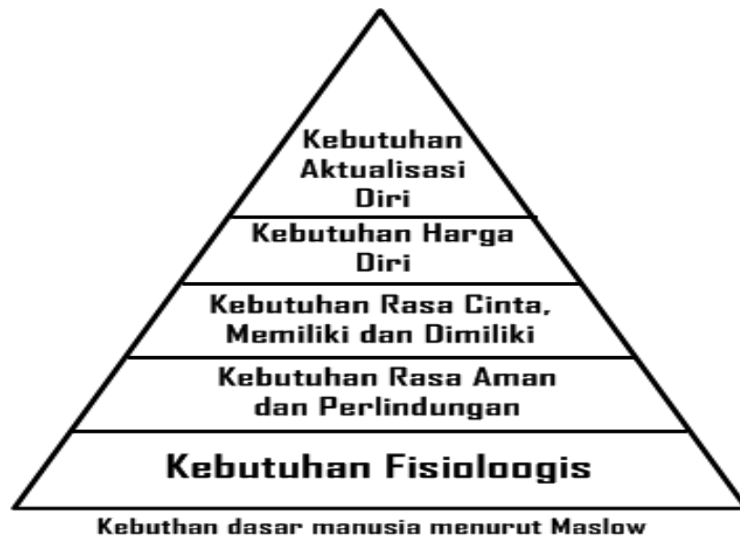
Gambar 2.2 Hirarki Kebutuhan Dasar Menurut A. Maslow

Berdasarkan teori di atas, pada klien dengan Post Sectio Caesarea mengalami gangguan kebutuhan fisiologis yaitu kebutuhan yang paling dasar seperti eliminasi, istirahat dan tidur, serta kebutuhan seksual.