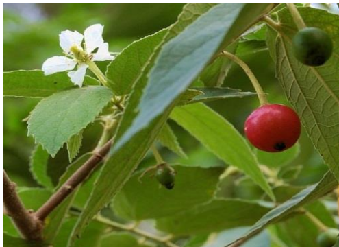
Gambar 2.1. Pohon Kersen.