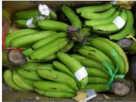
Gambar 2.2 Pisang Ambon

Pisang ambon merupakan panganan yang dapat dikonsumsi pada semua umur tanpa memiliki efek samping, selain mudah didapatkan dan harga relatif murah dibanding buah lainnya. Pisang ambon mudah ditemukan di daerah tropis. Pisang ini memiliki laju pertumbuhannya yang sangat cepat dan terus-menerus sehingga menghasilkan jumlah pisang yang banyak. Satu pohon dapat menghasilkan 7–10 sisir dengan jumlah buah 100 -150. Klasifikasi tanaman ini adalah sebagai berikut.