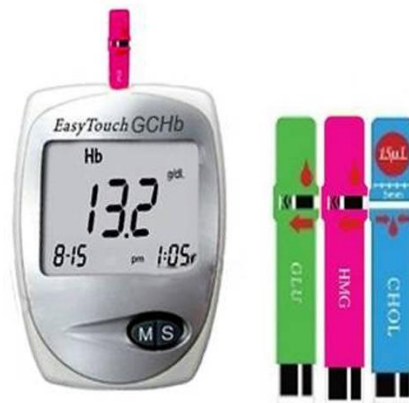
Gambar 2.1 Easy Touch GCHB

Hb Easy Touch GCHb merupakan alat kesehatan digital multichcek yang juga digunakan untuk mengukur hemoglobin yang penggunaannya akurat, tidak sakit, kapan saja dan dimana saja. Alat ini sudah cukup akurat terbukti karena sudah lulus uji dan proses untuk mengetahui hasilnya cukup cepat serta sangat mudah dalam penggunaannya. Orang awam sekalipun bisa menggunakan alat ini