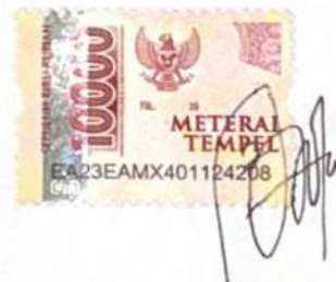
Zahra Fadia Salsabilla