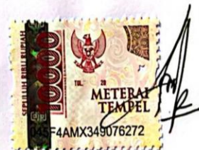
Ayu Rita Milawati