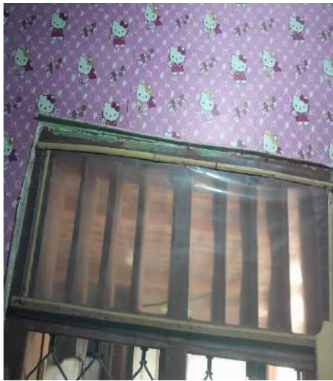
Kondisi ventilasi ruang tidur