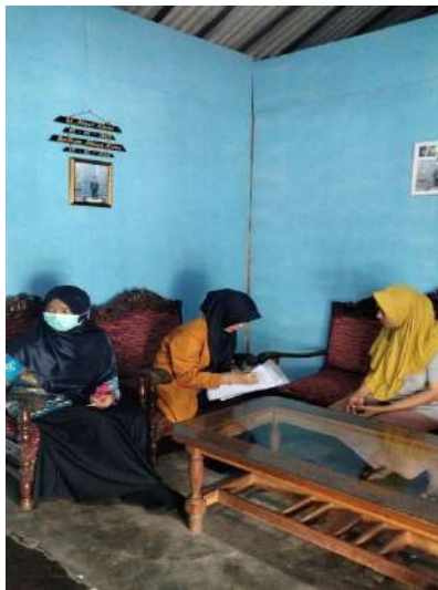
Wawancara Bersama responden