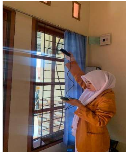
Pengukuran laju ventilasi