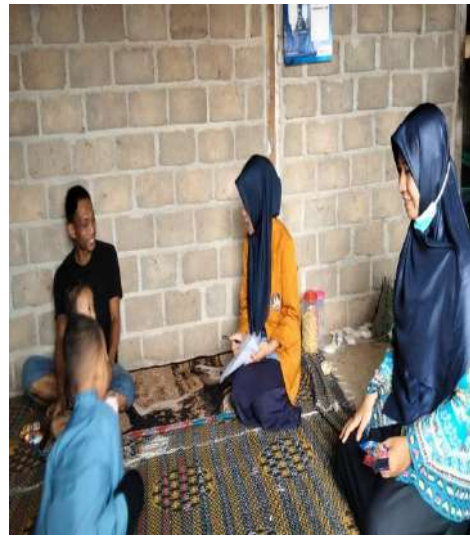
Wawancara Bersama responden