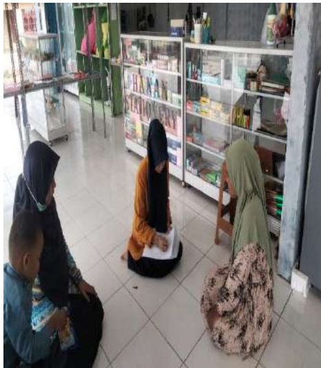
Wawancara bersama Responden