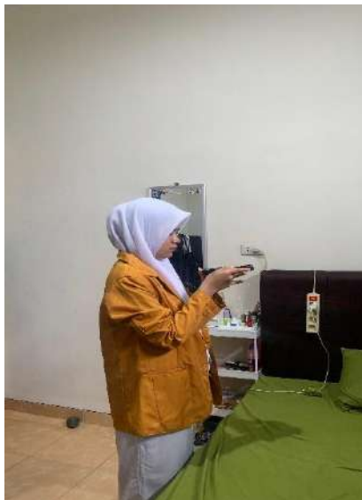
Pengecekan lux meter