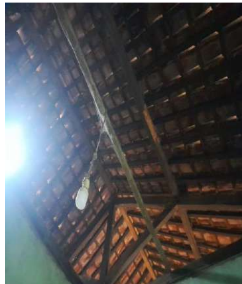
Kondisi langit-langit ruang tidur responden