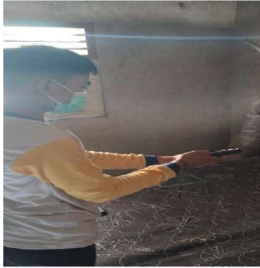
Kelembaban dan Pencahayaan