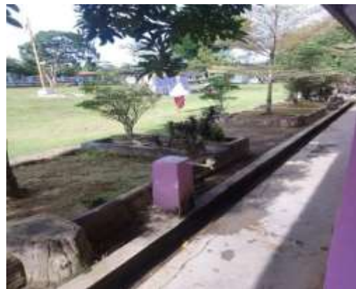
Sarana cuci tangan