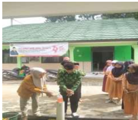
Praktik cuci tangan