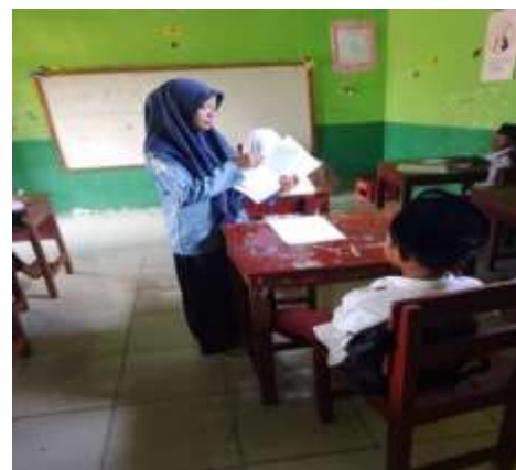
Siswa menjawab kuesioner