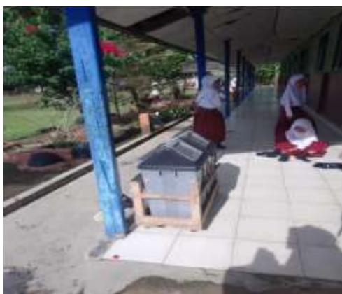
Tempat Pembuangan sampah