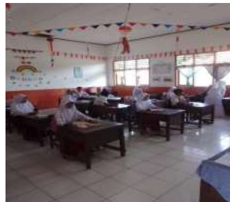
Siswa memberikan jawaban kuesioner