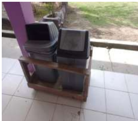
Tempat Pembuangan sampah