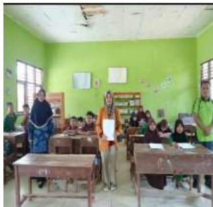
Siswa memberikan jawaban kuesioner