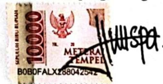
Salsa Putri Amelia