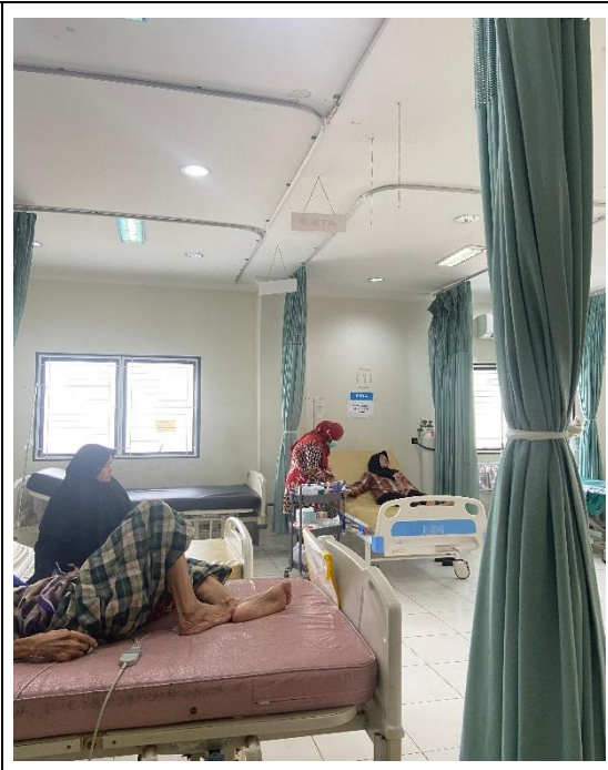
Pasien datang ke IGD