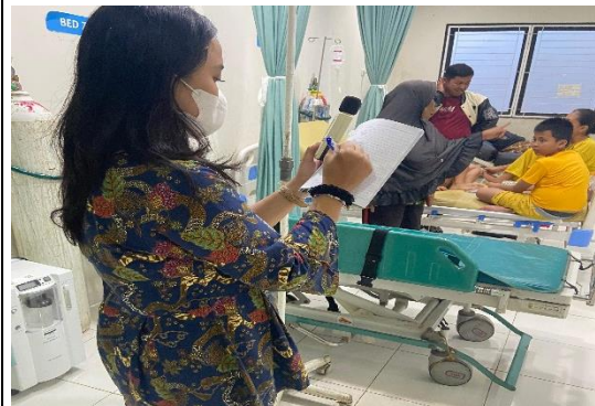
Pengukuran Parameter Fisik