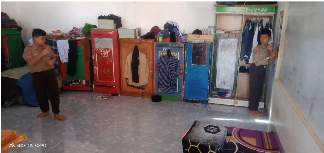
Salah 1 Kondisi Kamar Santriwan