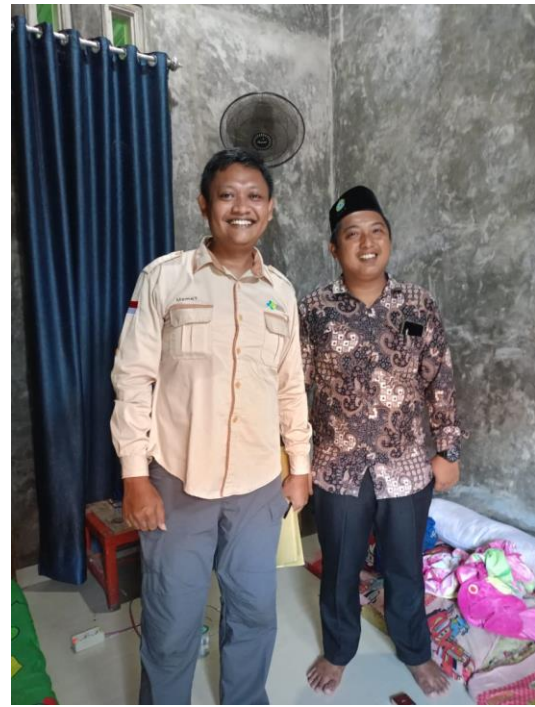
Melihat Kondisi Salah 1 Kamar Pengurus