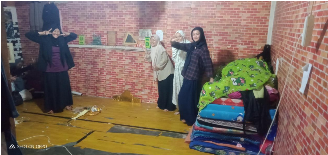
Kondisi Salah 1 Kamar Santriwati