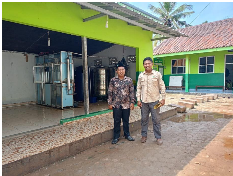
Melihat Sarana Air Minum