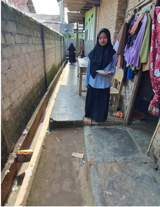
Kondisi Saluran Air Limbah