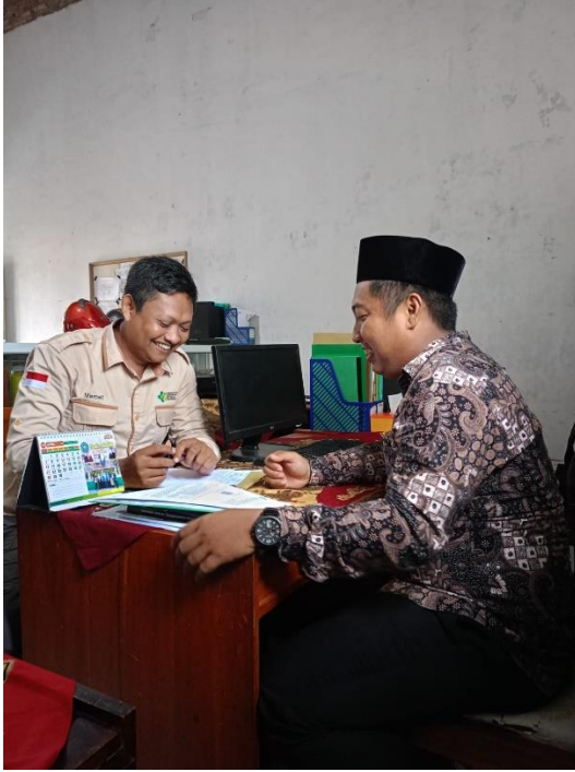
Wawancara Responden Kepala MTs