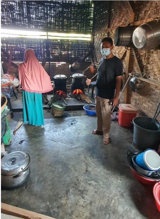
Melihat Kondisi Dapur