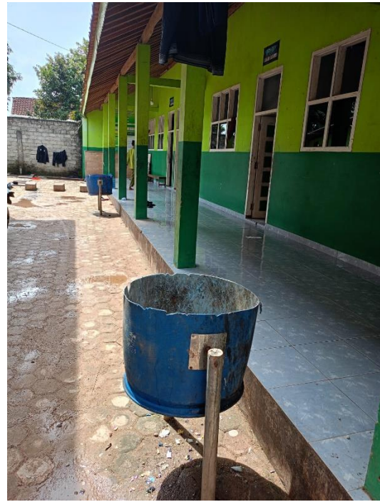
Melihat Kondisi Tempat Sampah