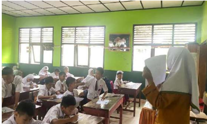
Memberikan Penjelasan Pengisian Lembar Kuesioner Penelitian