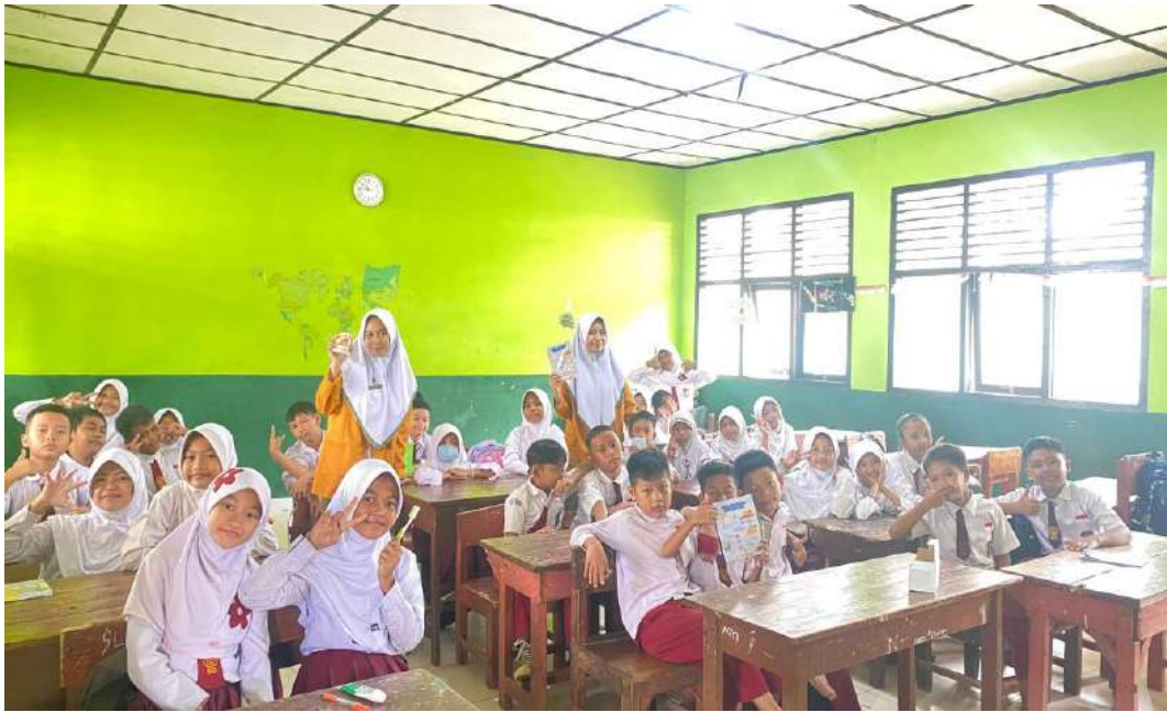
Melakukan Demonstrasi Sikat Gigi