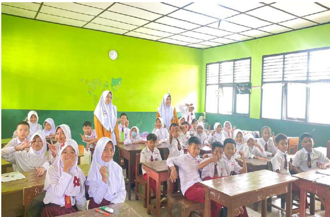
Melakukan Foto Bersama Responden