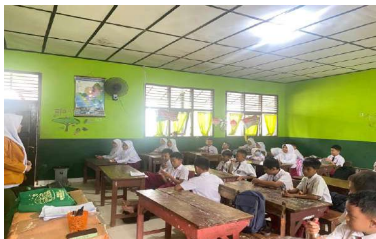
Melakukan Perkenalan Diri Terlebih Dahulu