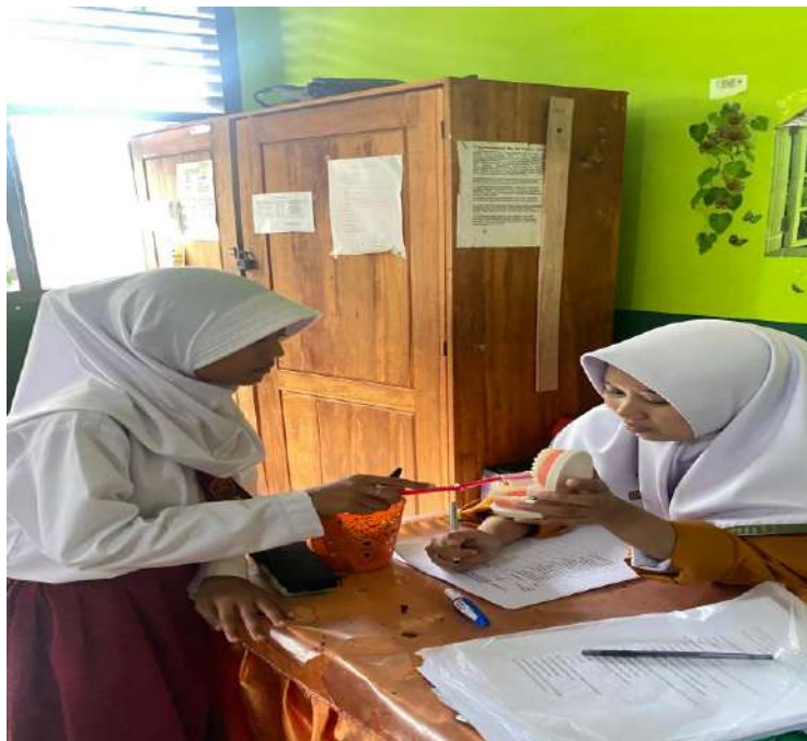
Melakukan Pengisian Lembar Observasi