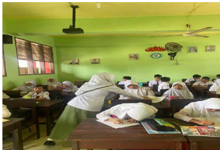
Melakukan Pembagian Kuesioner Untuk Uji validitas