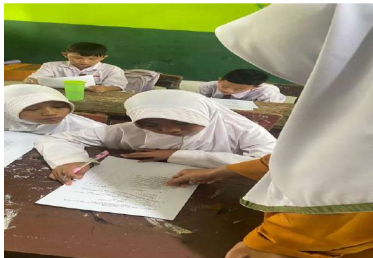
Menjelaskan Pengisian Kuesioner