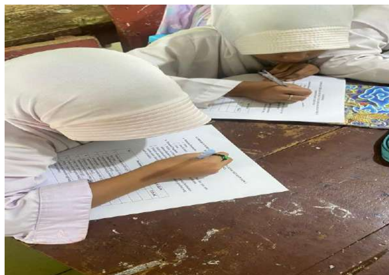
Responden Melakukan Pengisian Kuesioner