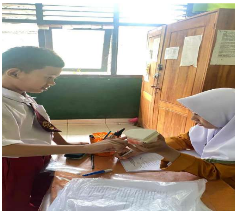
Melakukan Pengisian Lembar Observasi