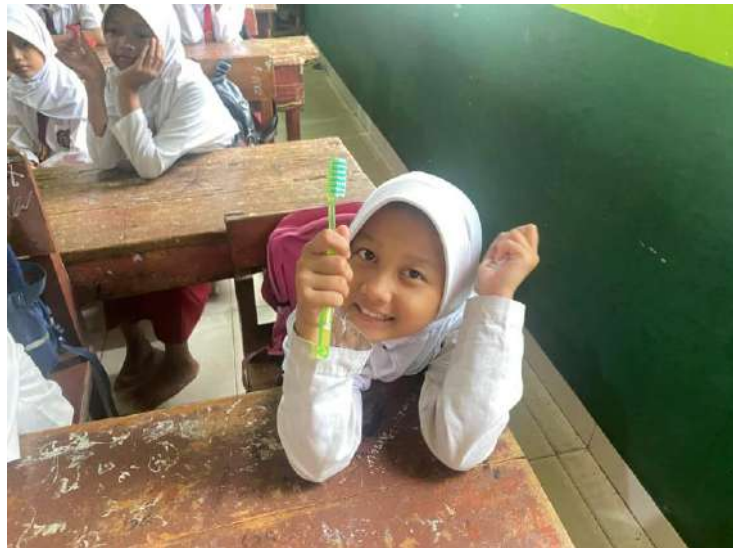
Responden Membawa Sikat Gigi