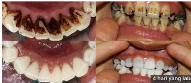
Gambar 2.1 Kalkulus Akibat Merokok

Bentuk kalkulus subgingival dapat dibedakan menjadi endapan nodular dan spring yang keras, terbentuk sekitar gigi, berbentuk jari, berbentuk cincin yang mencapai bagian bawah saku, merupakan bentuk gabungan dan bentuk bentuk tersebut diatas.