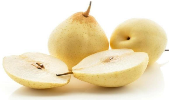
Gambar 2.1 Buah pir (Dayat, S., 2012: Hal. 529)