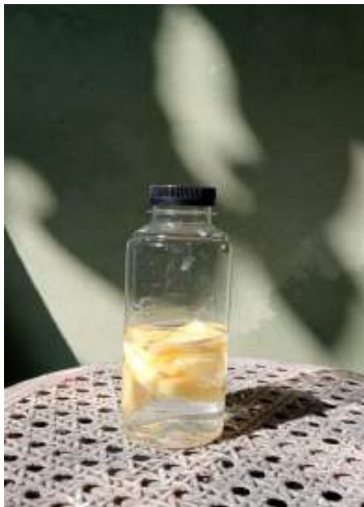
Pembagian Informat Consent