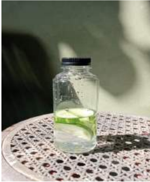
Infused water nanas dalam air 100ml