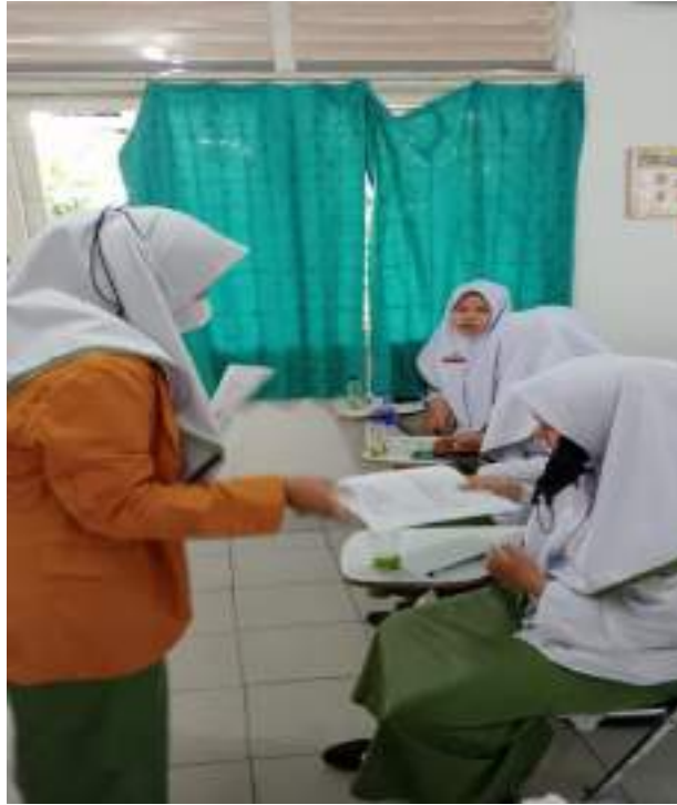
Pembagian Infused Water