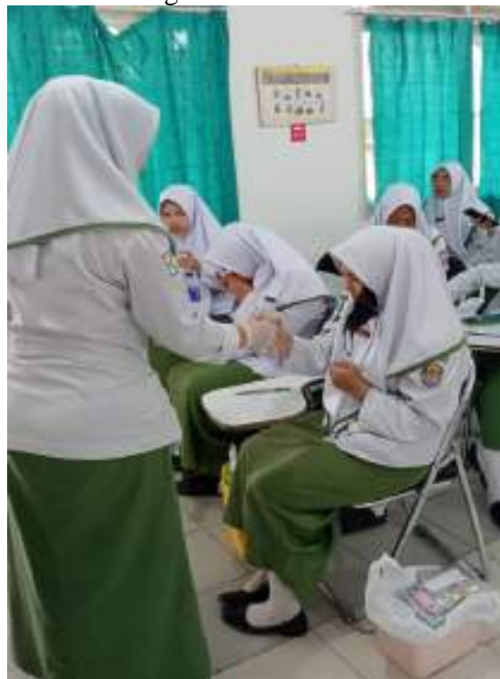
Pengambilan sampel Saliva