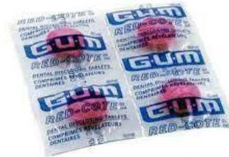
Gambar 2.3 Disclosing Tablet

Tablet disclosing dikunyah kemudian diratakan keseluruh permukaan gigi. Selama penggunaan, disarankan tidak berkumur dan meludah karena akan menghilangkan efek disclosing solution.