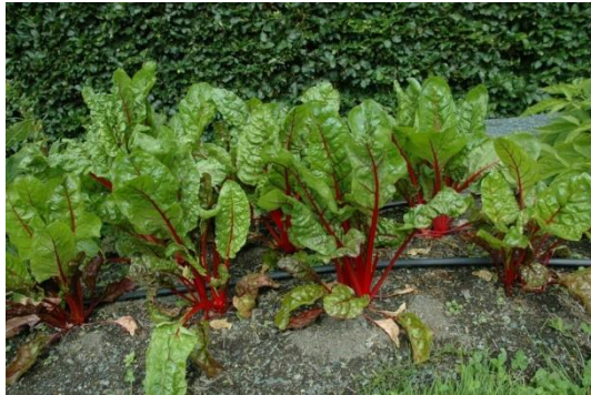
Gambar 2.5 Buah Bit Putih

Jenis bit ini ditanam untuk menghasilkan bagian daun yang besar. Tulang daunnya memiliki ukuran yang besar dan memiliki varian warna yakni putih, merah, maupun hijau. Buah bit putih memiliki daging yang berwarna merah keputih-putihan serta memiliki tekstur yang renyah.