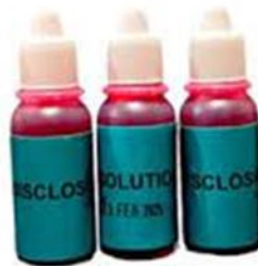
Gambar 2.2 Disclosing Cair

Diteteskan 3-5 tetes dibawah lidah kemudian diratakan keseluruh gigi. Selama penggunaan, disarankan untuk tidak berkumur dan meludah karena akan menghilangkan efek disclosing.