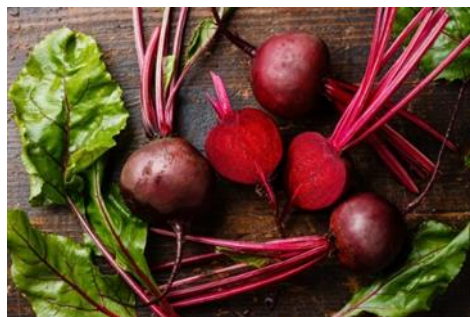
Gambar 2.4 Buah Bit

Tanaman bit merupakan dalam kelompok tanaman yang bersifat berpembuluh dan menghasilkan biji dikotil berkeping dua serta mekar bunga. Daunnya memiliki bentuk lonjong yang tipis dan bergerigi. Daunnya ini memiliki tulang dan urat berwarna merah. Buah bit tidak memiliki batang, tangkai daun yang berwarna merah berkumpul membentuk helaian daun di permukaan tanah. Setiap bagian dari tanaman ini, baik tangkai, daun, maupun umbi, dapat dimanfaatkan sebagai bahan makanan. Namun. Yang seringkali dimanfaatkan adalah bagian umbi dengan kulit merah, yang sejajar dengan bagian dalamnya dan mengandung kadar pektin yang cukup tinggi.