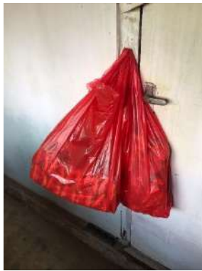
Tempat Pengangkutan Makanan