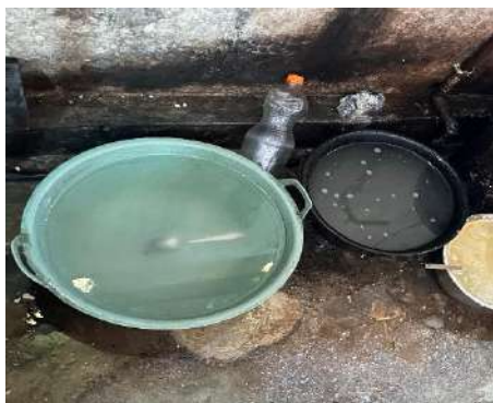
Air Bersih dan Tempat Cuci Peralatan