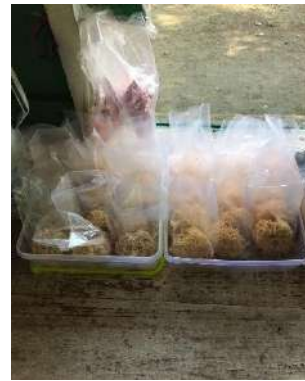
Tempat Penyajian Makanan