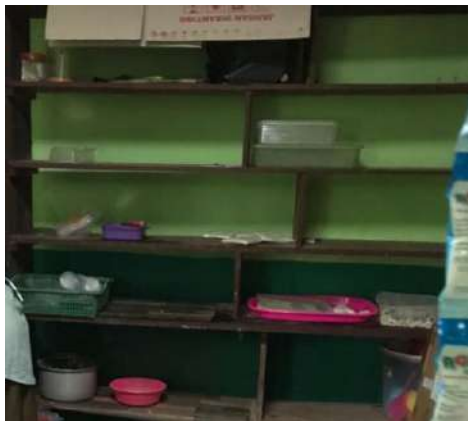
Tempat Penyimpanan Bahan Makanan