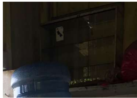
Tempat Penyimpanan Makanan