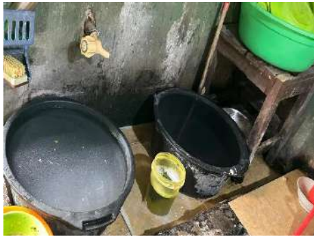
Air Bersih dan Tempat Cuci Peralatan