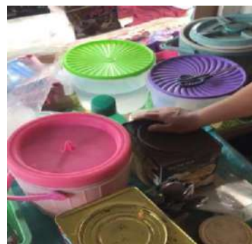
Tempat Penyajian Makanan