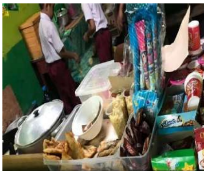
Tempat Penyajian Makanan