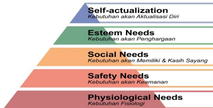
Gambar 2. 1 Hierarki Kebutuhan Maslow

Kebutuhan dasar manusia adalah unsur-unsur yang dibutuhkan manusia dalam mempertahankan keseimbangan fisiologis maupun psikologis, yang tentunya untuk mempertahankan kehidupan dan kesehatan. Manusia memiliki berbagai macam kebutuhan menurut intensitas kegunaan, menurut sifat, menurut bentuk, menurut waktu dan menurut subjek (Haswita & Sulistyowati, 2017).