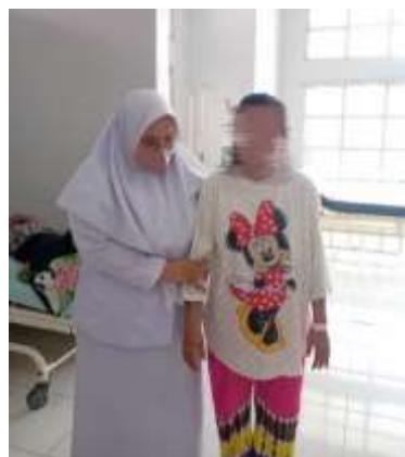
Mobilisasi hari ke-3 setelah operasi