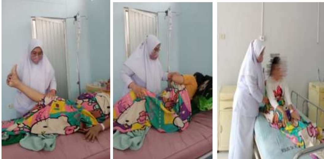
Mobilisasi hari ke-1 setelah operasi