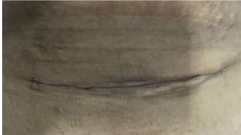
Hari ke-2 post operasi SC