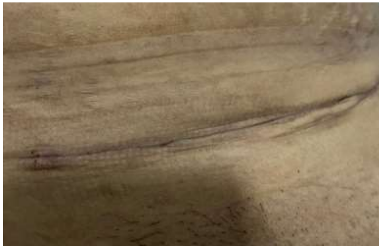
Hari ke-4 post operasi SC