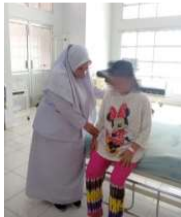
Mobilisasi hari ke-2 setelah operasi