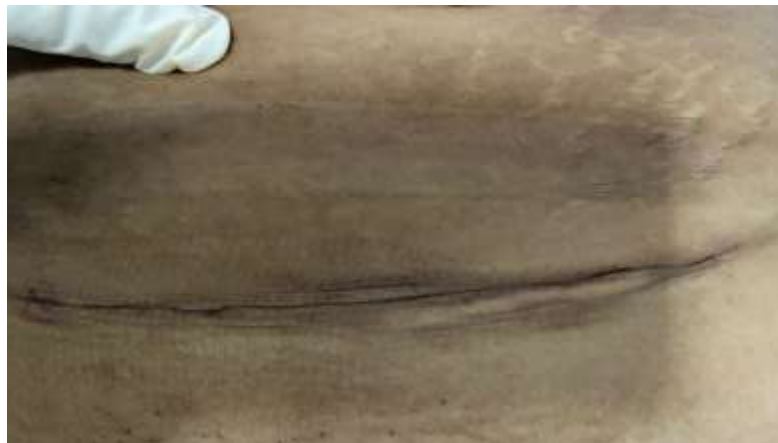
Hari ke-3 post operasi SC