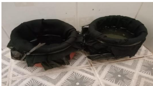
Toilet d4 wanita