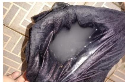
Ovitrap larutan gula ragi yang sudah ada jentik