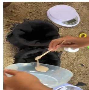
Masukkan ragi kedalam ovitrap yang sudah diberi larutan gula