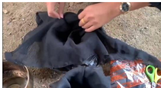
Pemasangan kain pada ovitrap