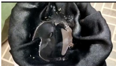
Ovitrap tanpa gula ragi yang sudah ada jentik