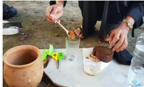
Masukan gula aren kedalam gelas