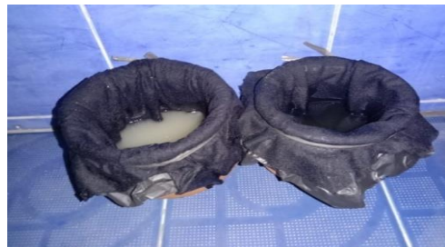
Toilet d3 pria