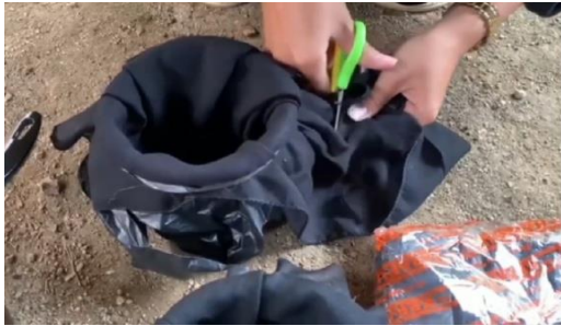
Proses penguntingan pada kain