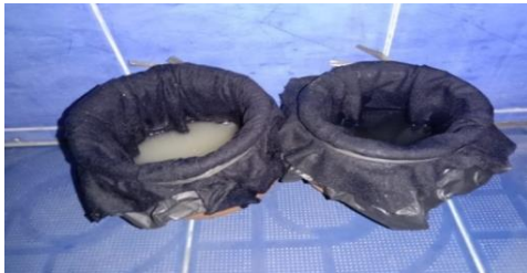
Toilet d3 wanita