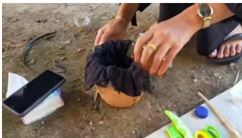
Masukan larutan gula ragi kedalam kedalam ovitrap