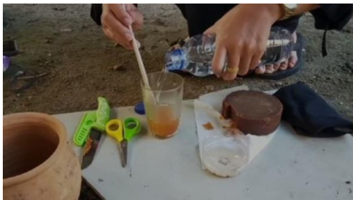
Larutkan gula dengan air panas