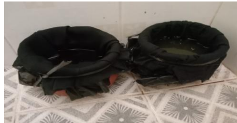
Toilet d4 pria