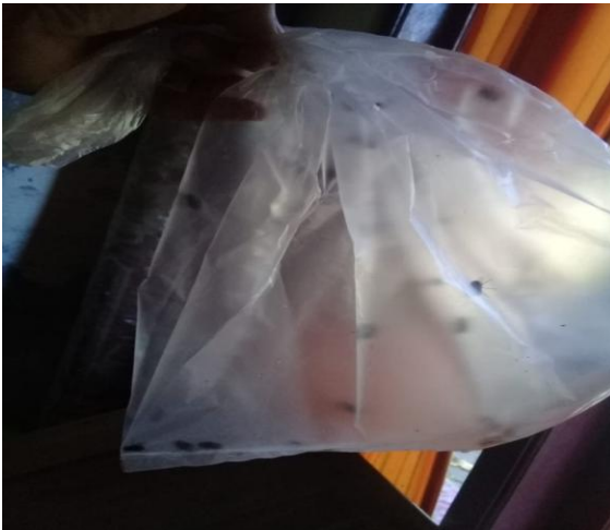
Sampel lalat rumah