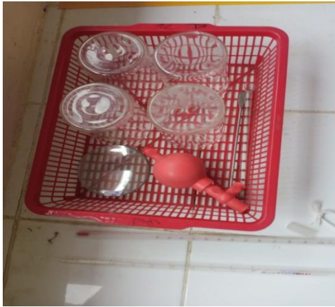
Bulb.Cawan Arloji,Beaker Glass