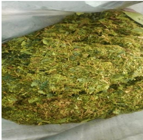
Daun cengkeh yang sudah dihaluskan