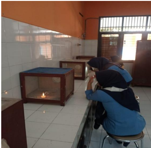
Uji kemampuan lilin