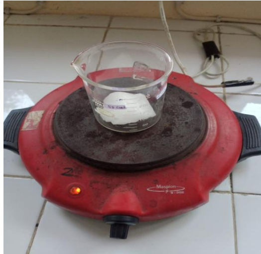
Parafin di panaskan