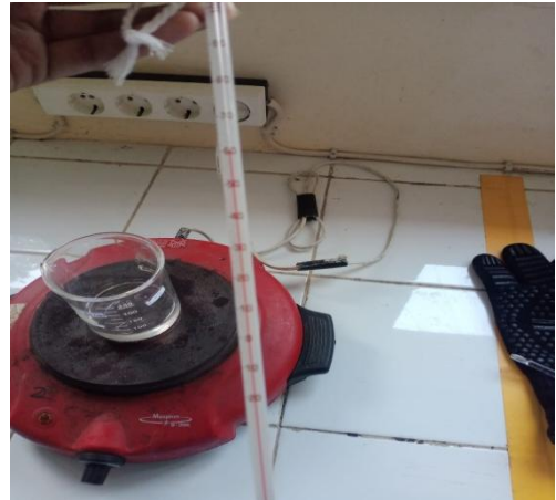
Suhu panas parafin