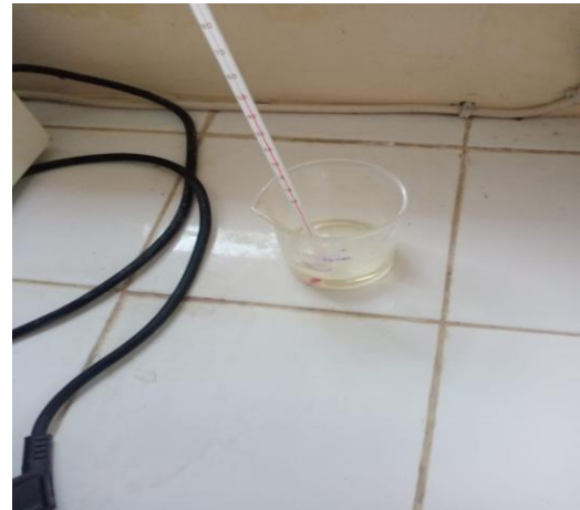
Suhu parafin yang telah diberi minyak atsiri