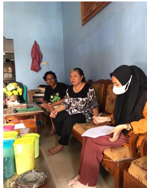
Foto Bersama Penderita Tuberculosis Paru di Wilayah Kerja Puskesmas Sukarame Kota Bandar Lampung