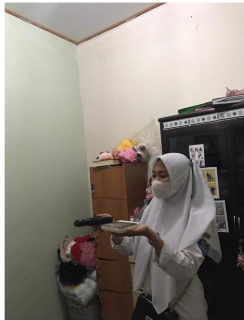
Pengukuran Kelembaban, Suhu dan Pencahayaan Menggunakan Alat Ukur Thermo Hygrometer dan Lux Meter di Rumah Penderita TB Paru di Wilayah Kerja Puskesmas Sukarame Kota Bandar Lampung