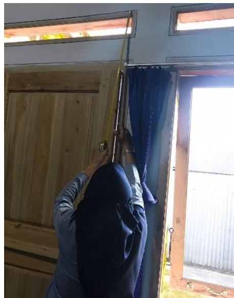
Pengukuran Ventilasi Dengan Menggunakan Alat Ukur Meteran di Rumah Penderita TB Paru di Wilayah Kerja Puskesmas Sukarame Kota Bandar Lampung