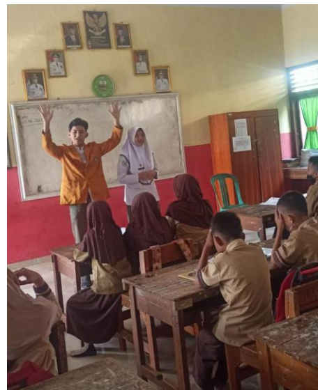
Penjelasan cara mengunyah buah sebanyak 32 kali