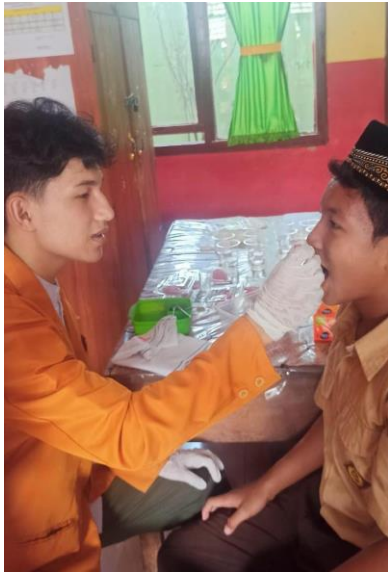
Pemberian disclosing sebelum mengunyah buah.