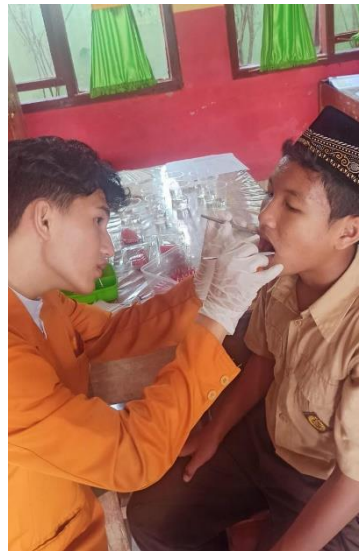
pemeriksaan debris indek sebelum mengunyah buah.