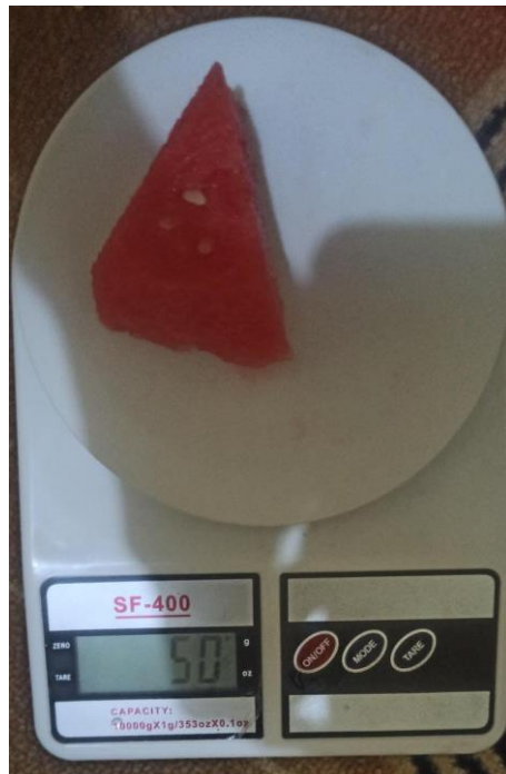
Buah semangka 50 gram