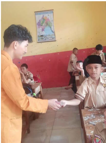
Pemberian buah untuk dikunyah