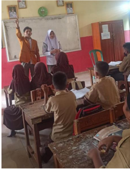
Responden mengunyah buah sebanyak 32 kali dipandu secara Bersama-sama