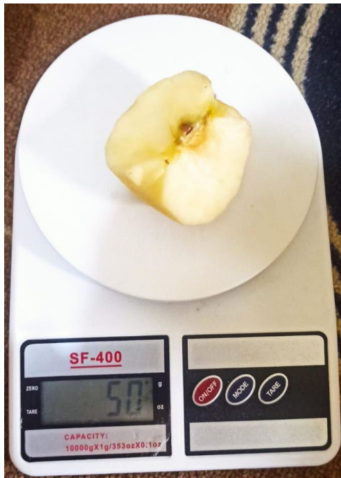
Buah apel 50 gram