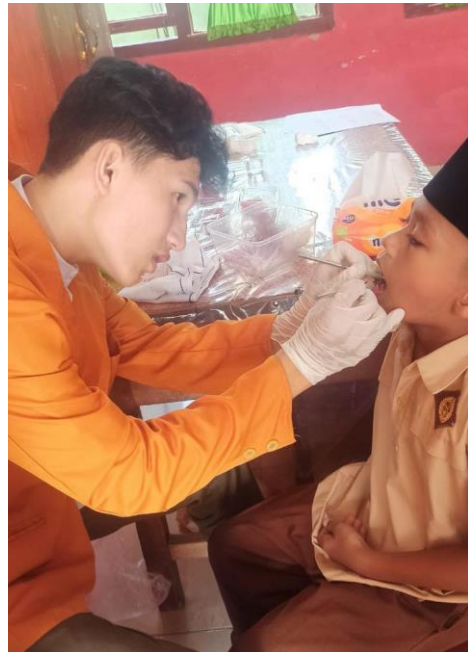
Pemeriksaan debris indeks sesudah mengunyah buah