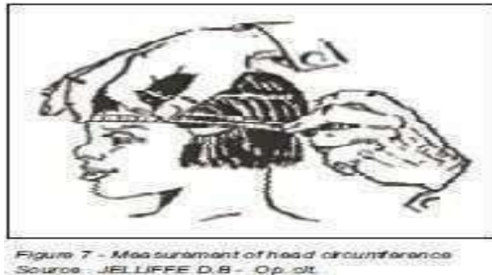
Gambar 3 Pengukuran Lingkar Kepala Anak