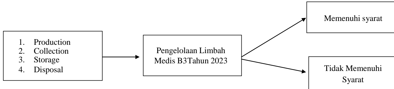
Gambar 2. 2 Kerangka Konsep