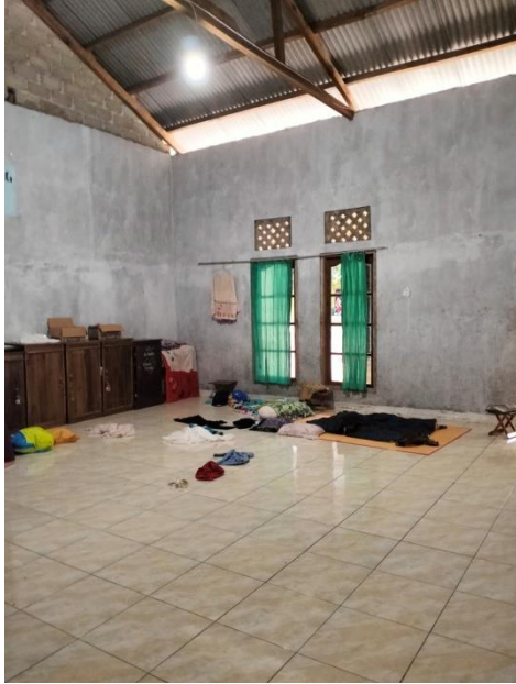
Kondisi Kamar Tidur