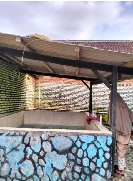
Bak Penampungan Air