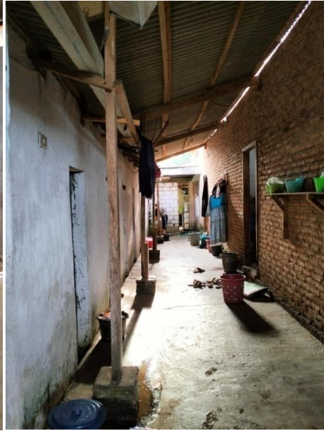
Kondisi Tempat Mencuci Pakaian