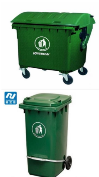
Gambar 1. Bak Sampah 1.200 ltr dan 240 ltr

awet, seperti wadah sampah dengan bahan dasar plastik atau fiber. Pengadaan wadah sampah yang awet juga akan menghemat pengeluaran pengelolaan sampah karena tidak perlu sering mengganti wadah sampah. Menurut rekomendasi pewardahan sampah di pasar dilakukan dengan menggunakan wadah bahan dasar fiber dengan volume 1.200 liter untuk sampah organik dan 240 liter untuk sampah anorganik (Mahyudin, 2017; Risman et al., 2018; Wildawati, 2020). Jumlah wadah sampah yang harus dibeli sekitar tiga unit untuk wadah sampah dengan volume 1.200 liter dan dua unit untuk wadah sampah dengan volume 240 liter. Peletakkan wadah sampah pada titik-titik vital pasar yang mudah di jangkau baik oleh pedagang, maupun oleh petugas pengangkut sampah.