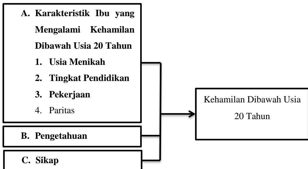
Gambar 2.1. Kerangka Teori

Berdasarkan tinjauan pustaka yang telah peneliti paparkan berikut merupakan kerangka teori tentang hubungan tingkat pendidikan, usia menikah, dan pengetahuan dengan kehamilan dibawah usia 20 tahun.