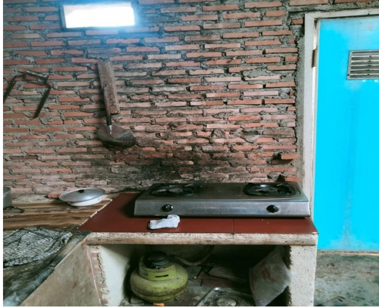
Penggunaan Gas LPJ