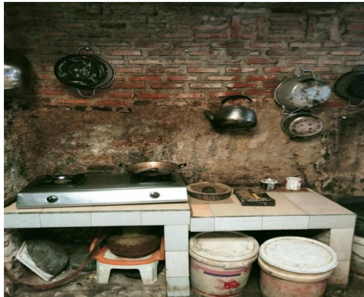
Penggunaan Gas LPJ