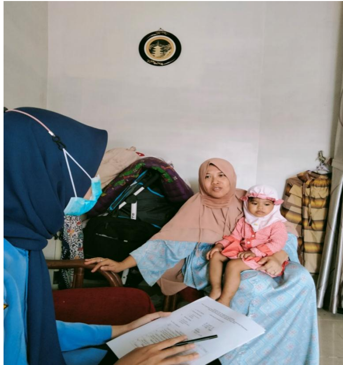
Proses wawancara responden