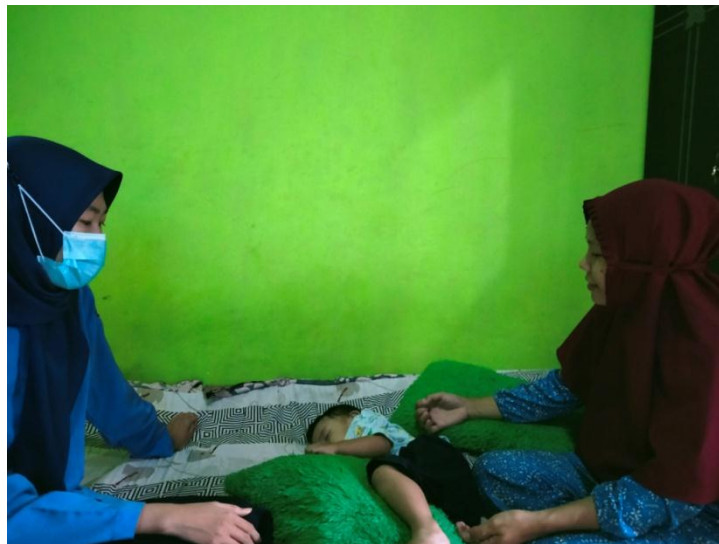
Proses wawancara responden