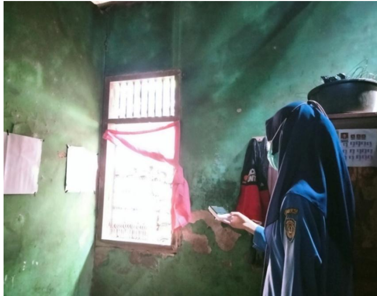
Kamar yang mempunyai ventilasi