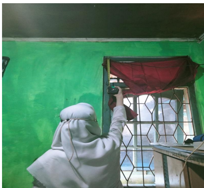
Mengukur ventilasi kamar tidur balita