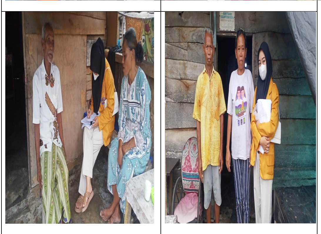
Foto Bersama Responden di Wilayah Kerja UPTD Puskesmas Kotaagung