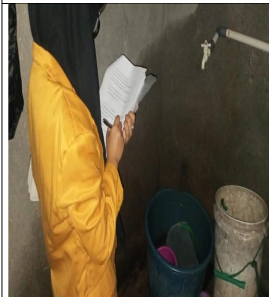
Kondisi Jamban Responden