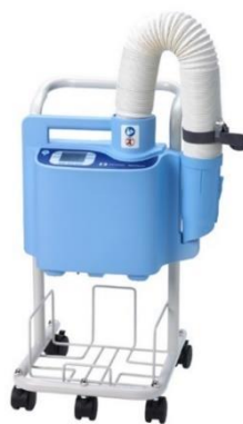
Gambar 2.1 Alat Blanket Warmer

Pengguna hanya perlu memasukkan suhu sesuai keinginan pada keypad , LCD akan menampilkan perubahan suhu serta pengaturannya (Wismantara, 2019).