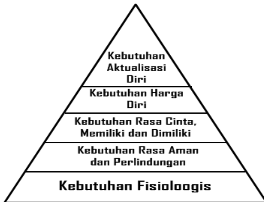
Gambar 2.2 Hierarki kebutuhan dasar manusia Maslow

Manusia mempunyai kebutuhan yang harus dipenuhi, baik fisiologis maupun psikologis, banyak ahli fisiologis dan psikologis yang menguraikan kebutuhan manusia dari berbagai segi salah satunya Abraham Maslow, seorang psikologis mengembangkan teori tentang kebutuhan dasar manusia. Menurut Abraham Maslow kita perlu memahami bahwa manusia selalu berkembang, kebutuhan yang lebih tinggi tidak akan terpenuhi dengan baik sampai kebutuhan terbawahnya terpenuhi. Kebutuhan dasar Abraham Maslow lebih dikenal dengan istilah Hierarki Kebutuhan Dasar Manusia Maslow . Hierarki tersebut meliputi lima kategori kebutuhan dasar, yakni :