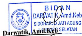
Darwatic, Amd. Keb