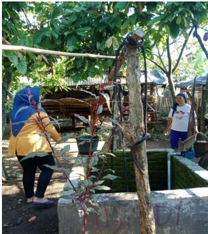
Jarak dari kandang ternak