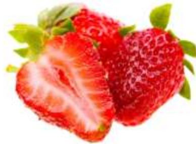
Gambar 2.1 Buah Stroberi