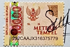
Septi Eka Novela