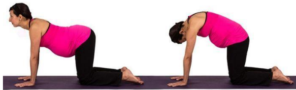
Gambar 2.6

Gerakan cat cow memperkuat otot-otot lumbosacral (ruas tulang belakang) terutama dinding otot abdomen dan otot gluteus. Meregangkan otot-otot yang memendek terutama otot ekstensor (otot yang meluruskan kembali ke posisi semula) punggung, otot hamstring dan otot quadratus lumborum (otot punggung), mengurangi gaya yang bekerja pada tulang punggung beban depan dan memperbaiki postur tubuh. Gerakan ini sempurna untuk mengatasi pegal-pegal dan nyeri punggung (Lampah et al.,2019)