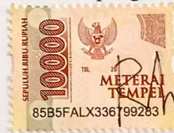
Rindi Indana Fitri