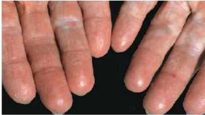
Gambar 2. 1 Dermatitis Kontak Iritan Akibat Mencuci Pakaian (Purwanthi, I Gusti Ayu Putri. 2016)