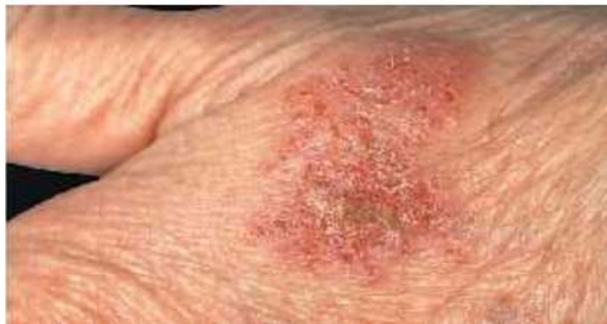
Gambar 2. 1 Dermatitis Kontak Alergi karena Nikel pada Jam Tangan (Purwanthi, I Gusti Ayu Putri. 2016)

dibutuhkan paparan secara berulang hingga mampu menimbulkan gejala. Selain itu, konsentrasi juga dapat berpengaruh terhadap kejadian dermatitis dimana makin tinggi konsentrasi bahan kimia tersebut, maka makin tinggi pula potensinya untuk merusak lapisan kulit. Hal tersebut juga berbanding lurus dengan jumlah kandungan bahan kimia yang mengenai kulit dalam kejadian dermatitis kontak.