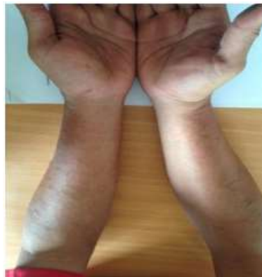
Gambar 2. 2 Dermatitis Kontak Fase Akut (Purwanthi, I Gusti Ayu Putri. 2016)

Memiliki gejala berupa bercak kemerahandengan tepian yang terlihat jelaslalu mengikuti dengan timbulnya edema, papulovesikel, dan munculnya lepuhan yang terasa gatal. Lepuhan ini disebut sebagai bula dan berisi cairan yang dapat pecah sewaktu-waktu dan saat telah kering akan menjadi koreng (krusta).