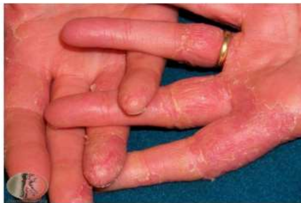
Gambar 2. 3 Dermatitis Kontak Fase Kronik (Purwanthi, I Gusti Ayu Putri. 2016)

Memiliki gejala berupa kulit yang terkena akan terasa kering, terjadinya penumpukan lapisan terluar kulit/stratum korneum, penonjolan kulit (papul), penebalan kulit dan timbul hiperpigmentasi pada kulit. Berikut ini ialah salah satu bentuk manifestasi klinis pada kejadian dermatitis kontak alergi.