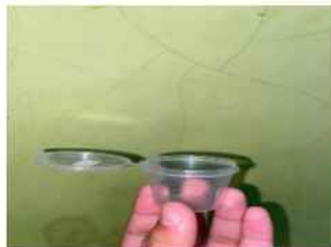
Cup Sputum saliva