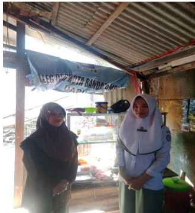
Wawancara Dengan Pemilik Kantin SDN 1 Gedung Meneng