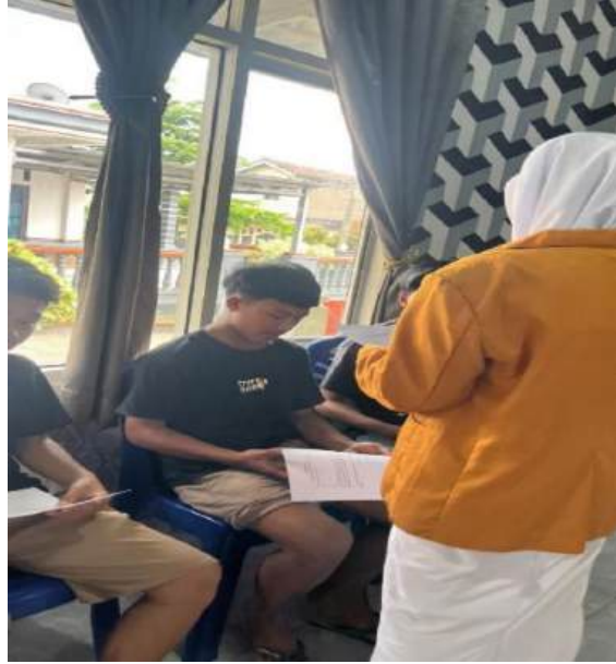
Membagikan infomed Consent