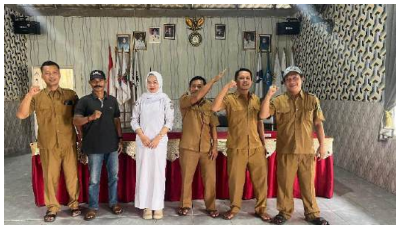
Foto Bersama Kepala Desa dan Pengurus Karang Taruna