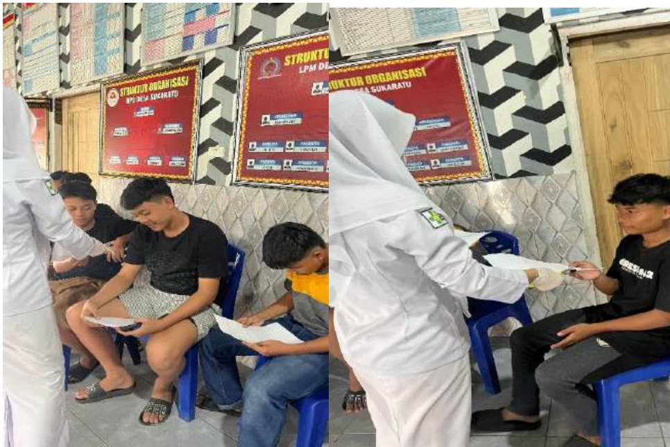
Membagikan Kuisiner kepada responden