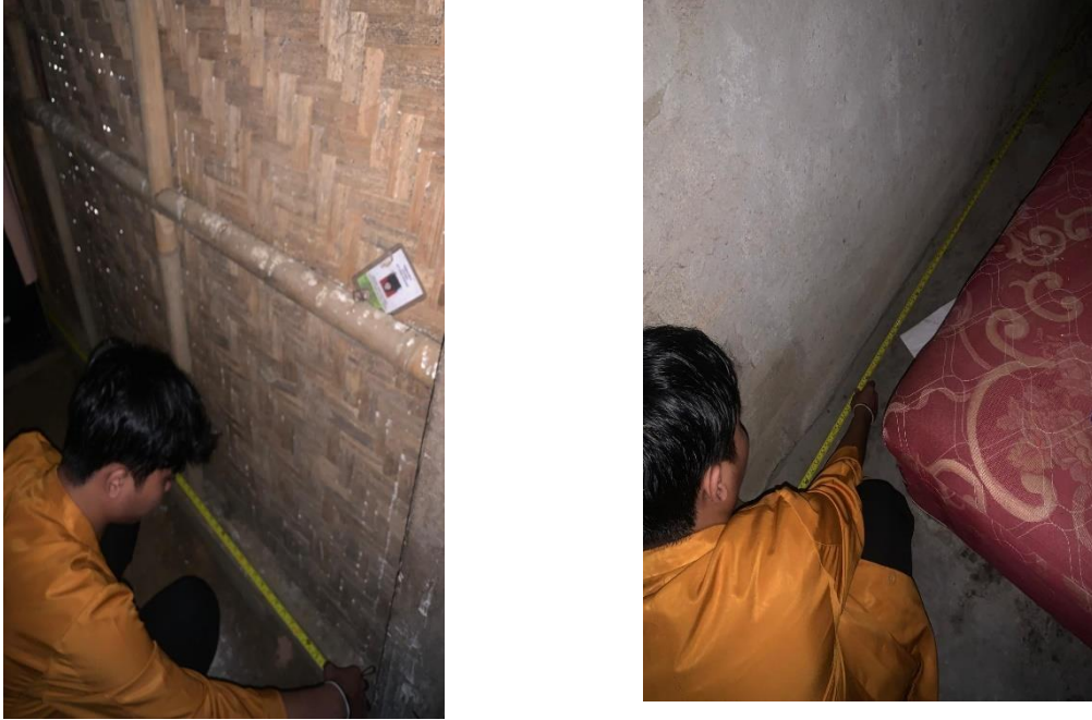
Gambar 5 Keadaan Kepadatan hunian Rumah Pada Penderita Tuberculosis Di Wilaya Kerja Puskesmas Bandar Agung