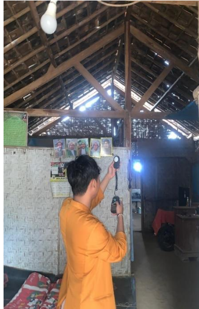
Gambar 4 Keadaan Pencahayaan Rumah Pada Penderita Tuberculosis Di Wilayah Kerja Puskesmas Bandar Agung