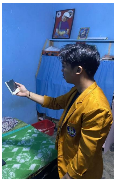
Gambar 3 Kedaaan Kelembaban Rumah Pada Penderita Tuberculosis Di Wilayah Kerja Puskesmas Bandar Agung