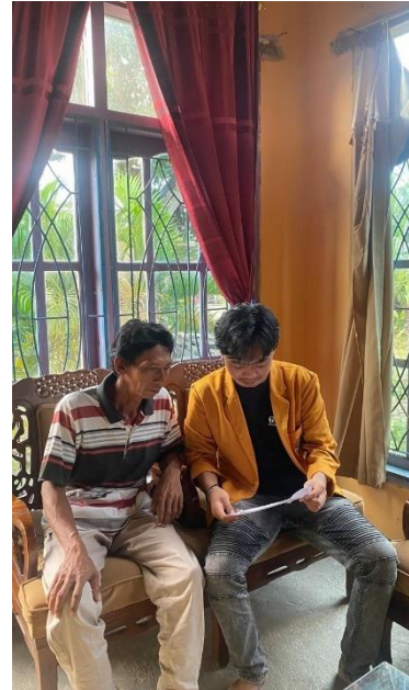
Gambar 6 Foto Bersama Pada Penderita Tuberculosis Di Wilayah Kerja Puskesmas Bandar Agung