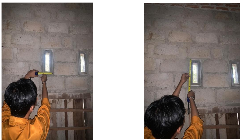
Gambar 2 Keadaan Ventilasi Rumah Pada Penderita Tuberculosis Di Wilayah Kerja Puskesmas Bandar Agung