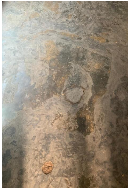
Gambar 1 Keadaan Lantai Rumah Pada Penderita Tuberculosis Di Wilayah Kerja Puskesmas Bandar Agung