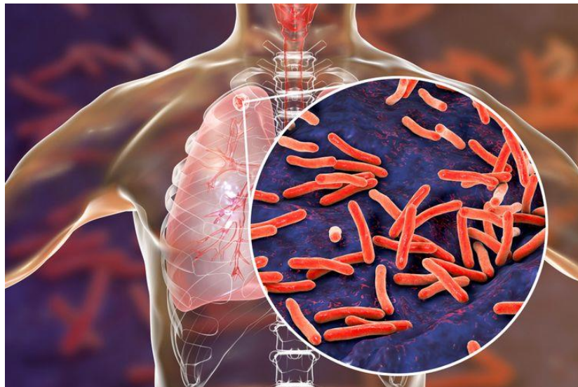
Gambar 2.1 Kuman Mycobacterium Tuberculosis (Kompas Health)

Tuberkulosis paru adalah penyakit menular yang disebabkan oleh kuman Mycobacterium tuberculosis . Terdapat beberapa spesies Mycobacterium antara lain: M.tuberculosis , M.africanum , M.bovis , M.leprae dsb. Yang juga dikenal sebagai Bakteri Tahan Asam (BTA). Kelompok bakteri Mycobacterium selain Mycobacterium tuberculosis yang bisa menimbulkan gangguan pada saluran nafas dikenal sebagai MOTT ( Mycobacterium Other Than Tuberculosis ) yang terkadang bisa mengganggu penegakan diagnosis dan pengobatan TB (PMK. 67, 2016).