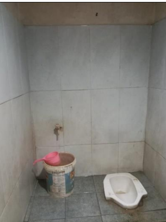
Pengamatan terkait sanitasi toilet sekaligus sarana cuci tangan di Terminal Rajabasa