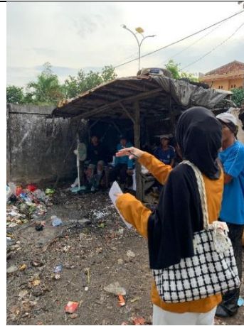
Wawancara terhadap petugas kebersihan