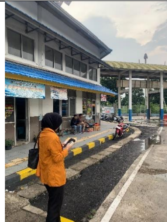
Pengukuran kebisingan di area loket Terminal Rajabasa