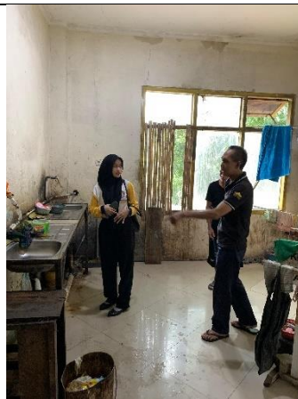
Pengamatan dan wawancara terkait pengelolaan air buangan di Terminal Rajabasa