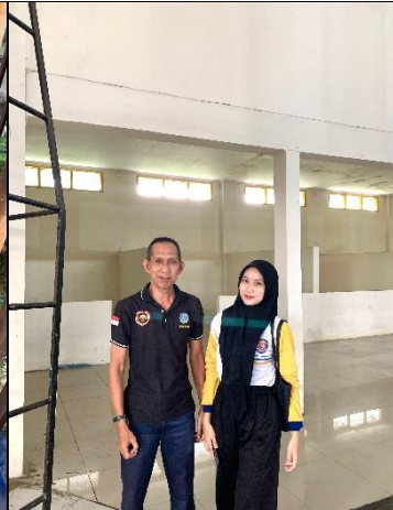
Dokumentasi Bersama petugas kebersihan