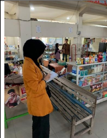
Pengukuran kebisingan di area kantin Terminal Rajabasa