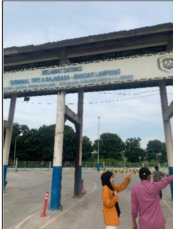
Wawancara terkait Gambaran umum Terminal Rajabasa