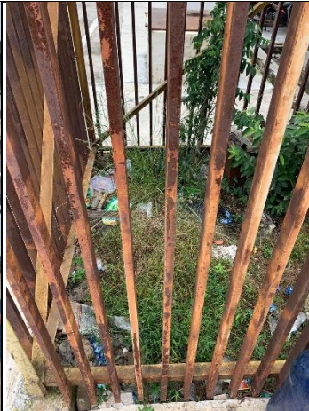
Sampah yang berserakan di Terminal