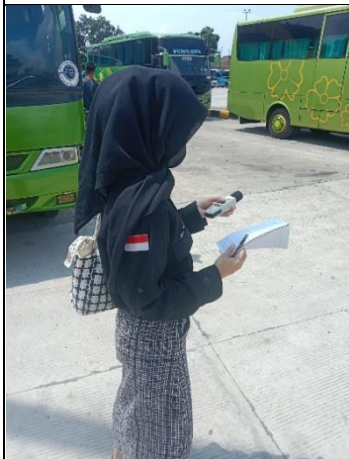
Pengukuran kebisingan di area pusat Terminal Rajabasa