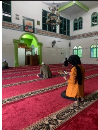
Pengukuran kebisingan di area masjid Terminal Rajabasa