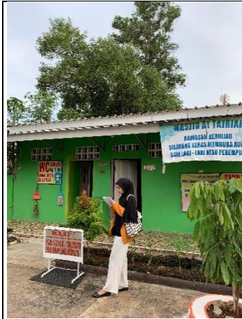
Pengecekan sanitasi toilet dan jamban