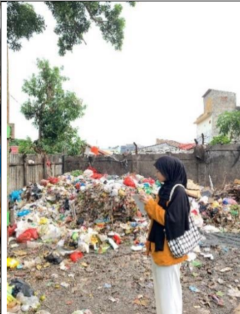
Pengamatan terkait TPA di Terminal Rajabasa