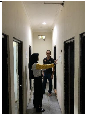
Pengamatan dan wawancara terkait jumlah toilet dan jamban di Terminal Rajabasa