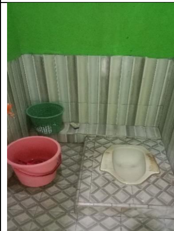
Pengamatan terkait sanitasi toilet sekaligus sarana cuci tangan di Terminal Rajabasa