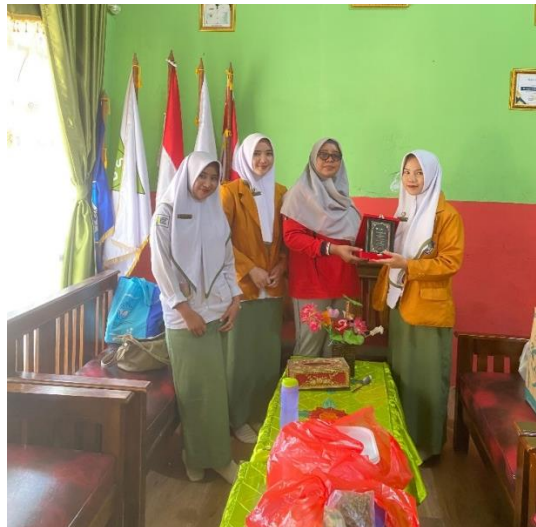
Foto Bersama dan pemberian plakat