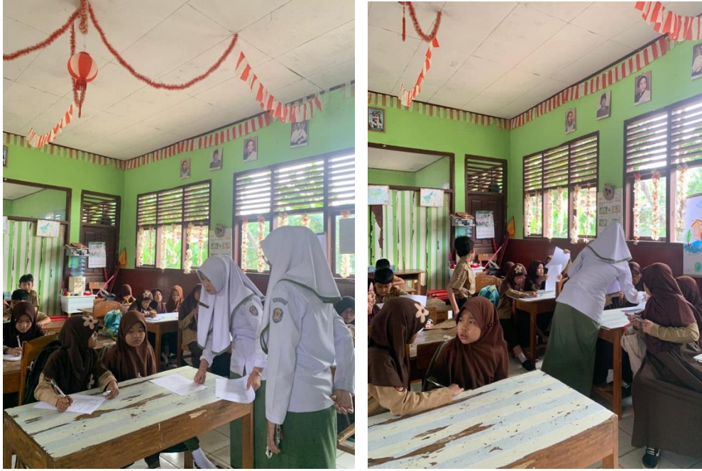
Pengisian kuesioner sesudah penyuluhan ( Post-test )