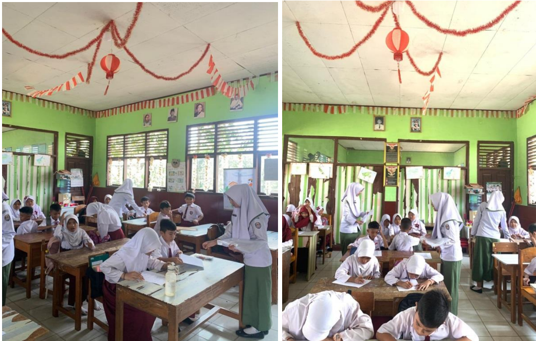
Pengisian kuesioner sebelum penyuluhan (Pre-test)