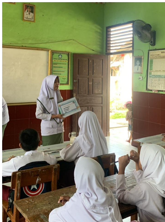
Penyuluhan menggunakan media Flipchrt