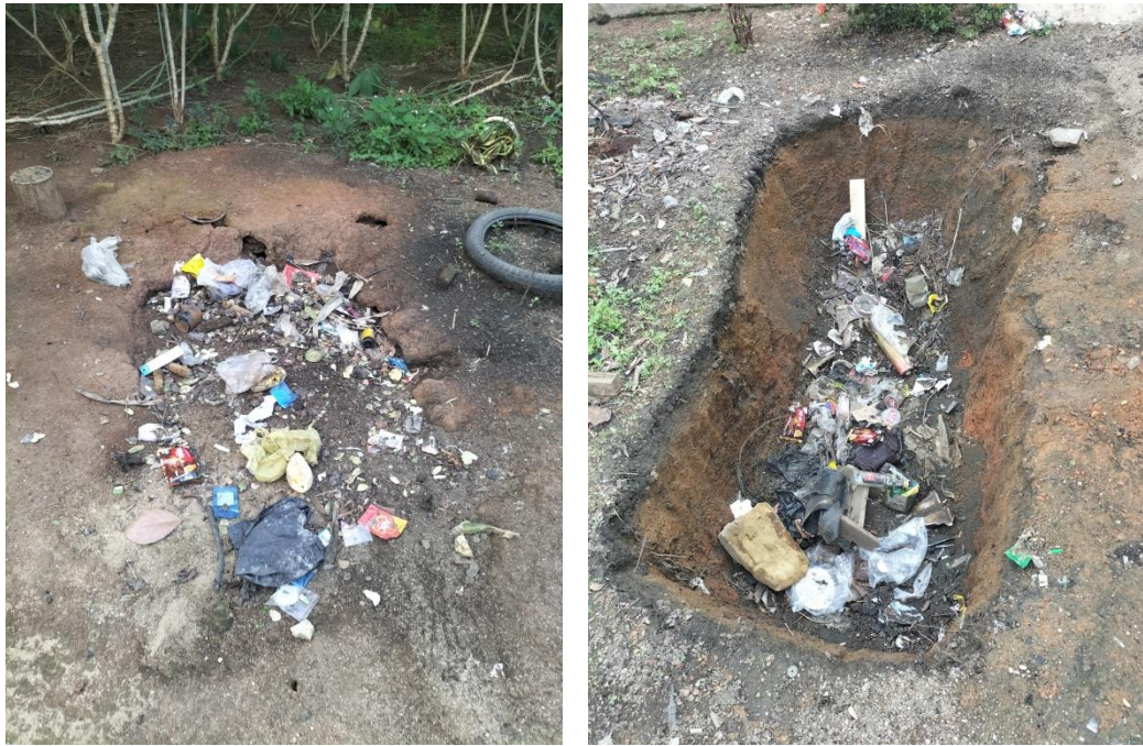
Kondisi Sarana Pembuangan Sampah