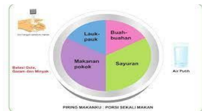
PIRING MAKANKU : PORSI SEKALI MAKAN

Weaning baru boleh mulai diterapkan ketika bayi sudah bisa duduk tegak agar ia dapat ikut duduk di meja makan bersama anggota keluarga lain.