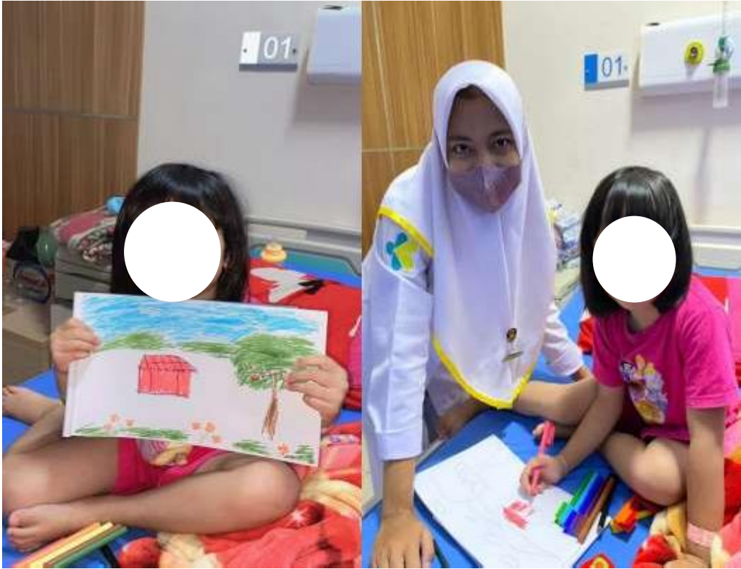
Lampiran 4: Foto-Foto Kegiatan Studi Kasus